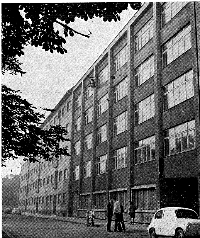
ZGRADA FAKULTETA POLITICKIH NAUKA U ZAGREBU

2. U izgradnji profila Fakulteta pošlo se od toga da je politologija jedinstvena znanstvena disciplina, pa da studij političke znanosti treba, u skladu s tim, shvatiti kao jedinstven teorijski studij. Na toj osnovi je i koncipiran i usvojen nastavni plan Fakulteta. S vremenom su došli prigovori i primjedbe da nastavni plan nije najbolje riješen, jer da mu nedostaje uža povezanost s političkom praksom i da ne daje odgovarajuća znanja potrebna diplomiranim politolozima u vršenju službe u radnim organizacijama. Zbog toga je Nastavničko vijeće na više sjednica razmatralo pitanje nastavnog plana i zaključilo da se u njemu izvrše izmjene u skladu sa spomenutim primjedbama. Osnovna koncepcija novog nastavnog plana jest da student treba u prve tri godine studija dobiti fundamentalno teorijsko obrazovanje, na koje se u četvrtoj godini nadovezuju putem usmjeravanja praktična znanja. Predviđena su tri smjera: teorijski politološki smjer, unutarnji politički smjer i vanjsko-politički smjer. Uz te smjerove predviđa se i fakultativni studij žurnalistike. Takav nastavni plan omogućava fizionomiranje studija a time i diplomirani-