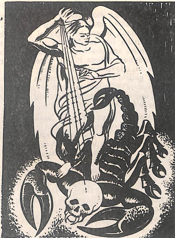
Znak Društva za borbu protiv raka u Zagrebu.

Društveni znak predstavlja crtež izrađen od slikara M. Trepšea, koji je vlasništvo društva, a predstavlja arkandela u borbi s rakom. Arkandeo je stao nogom raku, koji je prikazan sa mrtvačkom glavom, na vrat i podigao desnu ruku iz koje izlaze zrake prema raku. Taj znak društvo stavlja na svoj listovni papir, pisma, novčane potvrde, programe i plakate svojih priredaba i slično.