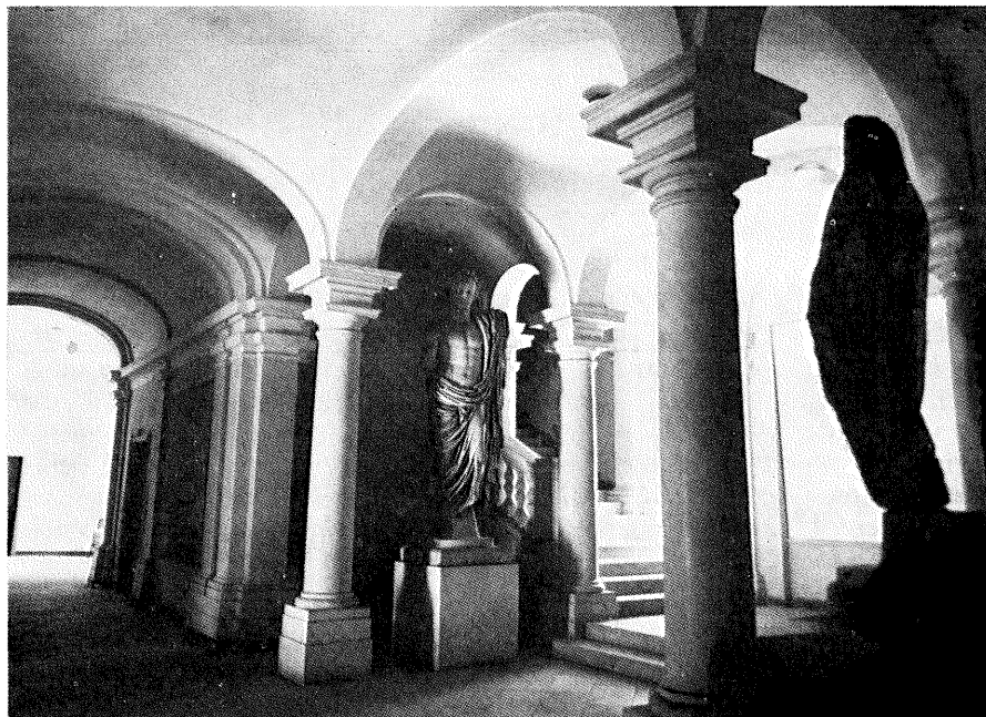
PREDVORJE U ZGRADI FILOZOFSKOG FAKULTETA U ZADRU

Na Fakultetu su u šk. god. 1967/68. postojali ovi odsjeci i katedre: