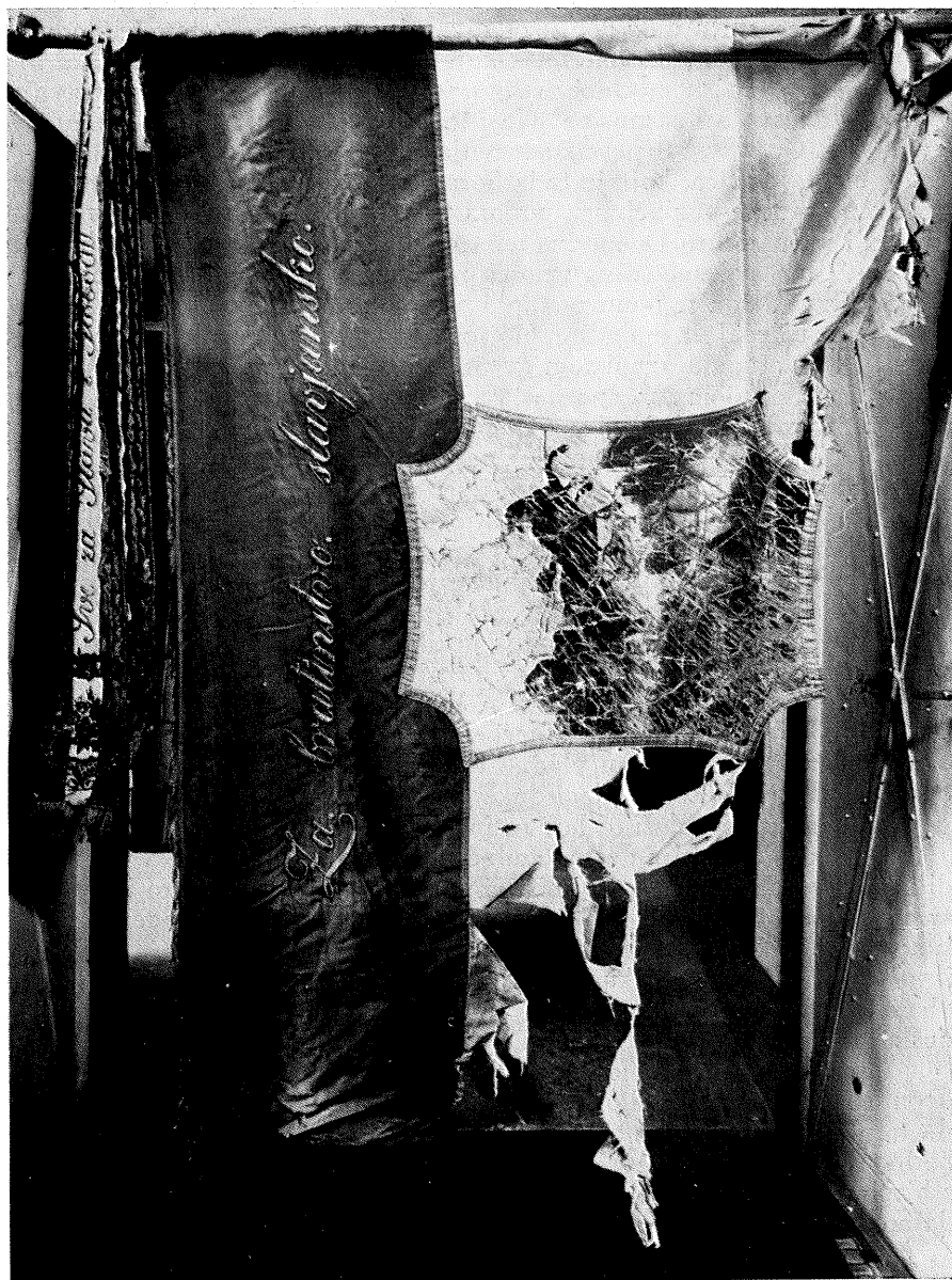
DRUGA STRANA ZASTAVE S NATPISOM »ZA BRATINSTVO SLAVJANSKO« — ZASTAVA SE ČUVA U SVEUČILIŠNOJ BIBLIOTECI U ZAGREBU