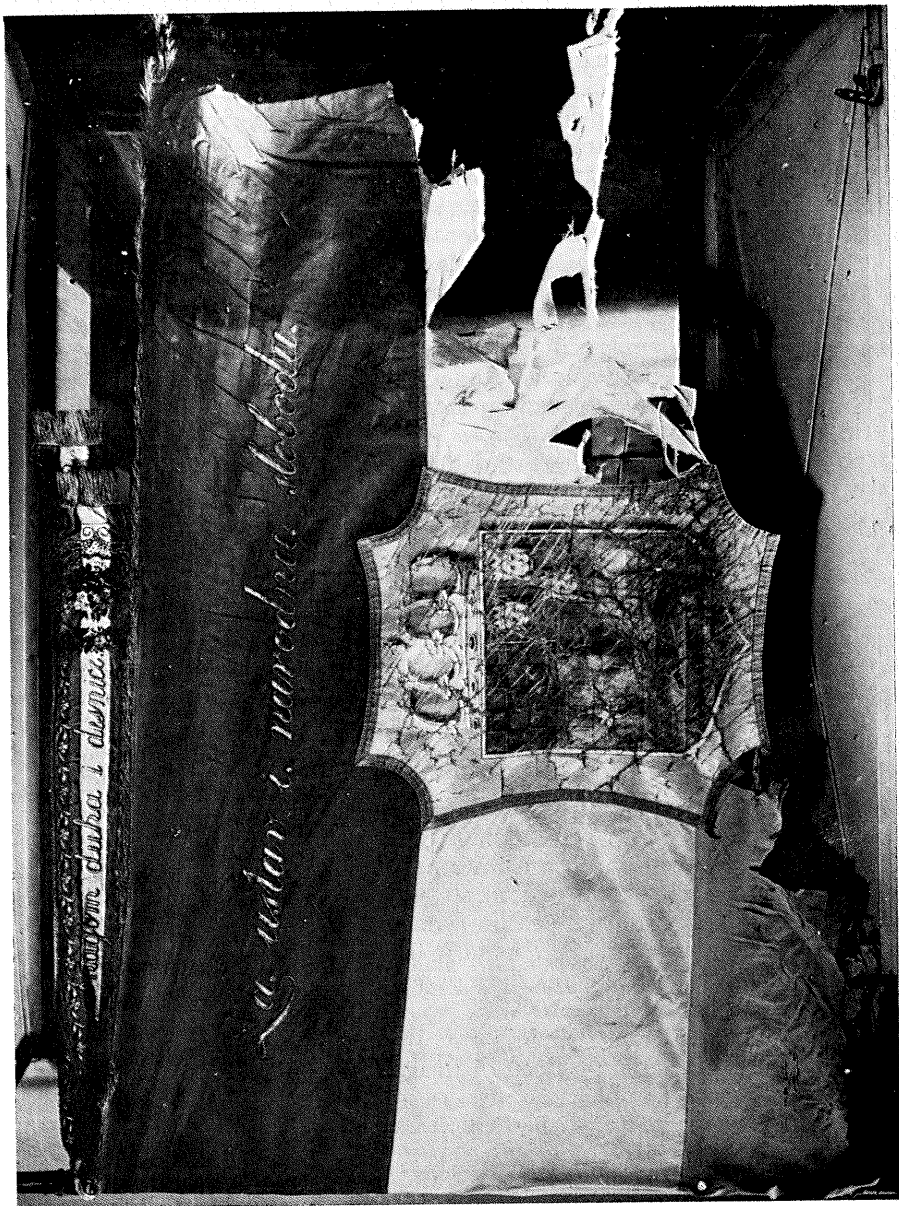
ZASTAVA »AKADEMIČKE ČETE« IZ GODINE 1848 — PREDNJA STRANA S NATPISOM »ZA USTAV I NARODNU SLOBODU«