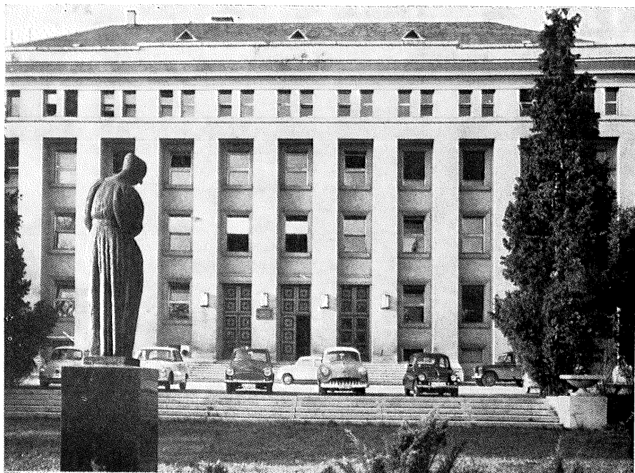
SKOLA NARODNOG ZDRAVLJA »ANDRIJA ŠTAMPAR« NA ŠALATI

Na osnovu Općeg zakona o univerzitetima od 30. IV 1954. Fakultet je postao samostalna društvena ustanova, te je 20. XI 1954. kao organ društvenog upravljanja imenovan Fakultetski savjet. U smislu odredbe Općeg zakona o univerzitetima donesen je statut Medicinskog fakulteta i potvrđen u Saboru NRH 26. IV 1956.