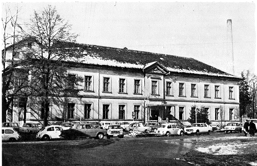
BOLNICA »DR MLADEN STOJANOVIĆ« U VINOGRADSKOJ ULICI (STARA ULICNA ZGRADA)

4. POSTDIPLOMSKU NASTAVU na Medicinskom fakultetu organizira i provodi od šk. god. 1947/48. Škola narodnog zdravlja »Andrija Štampar« i to za: a) naučno i stručno usavršavanje i specijalizaciju iz područja javnog zdravstva; b) usavršavanje zdravstvenih stručnjaka iz drugih zemalja, u suradnji s međunarodnim organizacijama; c) usavršavanje i specijalizaciju drugih kadrova za potrebe javne zdravstvene službe; d) nastavu za specijalizaciju iz opće medicine za stručnjake sa završenim visokoškolskim obrazovanjem drugog stupnja, u suradnji s odgovarajućim katedrama.