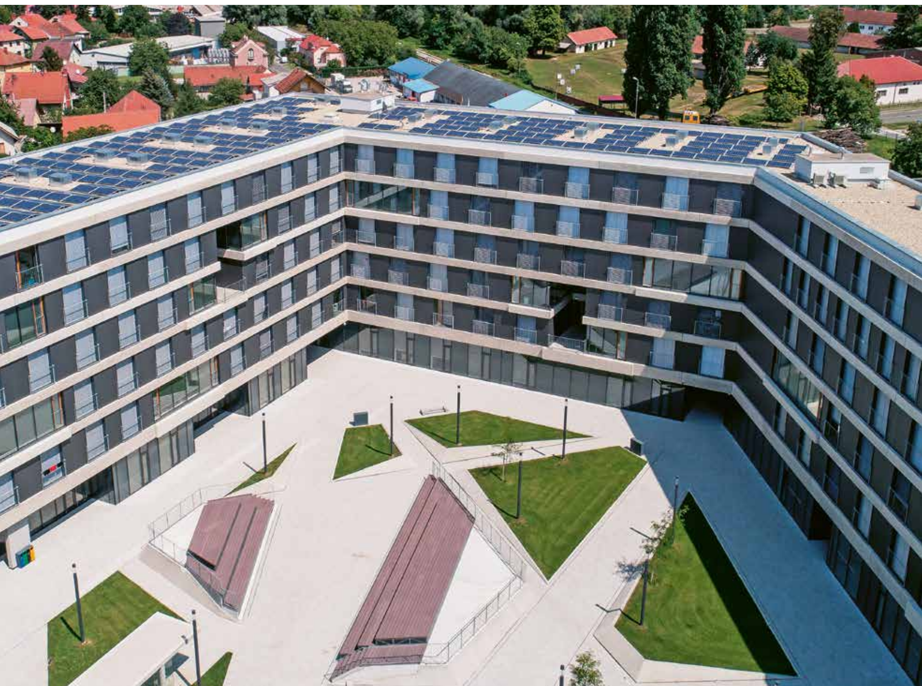
Studentski dom u Varaždinu.

Usluge prehrane studentima pruža ugostiteljski obrt bistro "Trattoria", a u prostoru Učiteljskog fakulteta u Petrinji, resoran studentske prehrane Index.