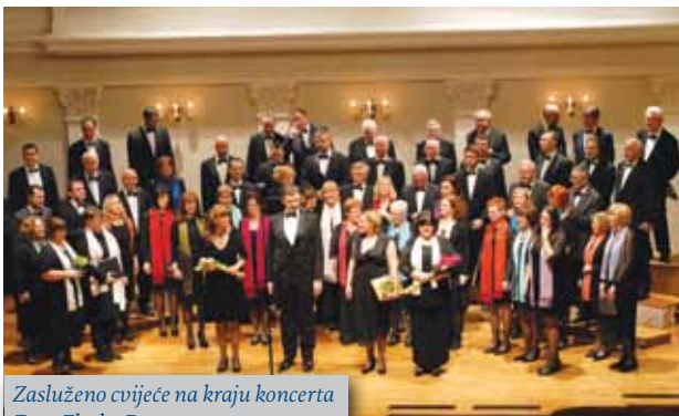
Zasluzeno cvijeće na kraju koncerta Foto: Zlatko Đuran

Kao i uvijek, primjeren dio Glasnika su izvješća sekcija AMACIZ-a.