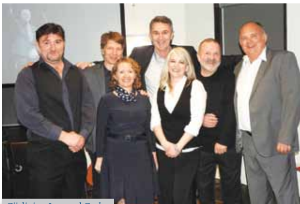
Cijeli tim Leonard Coehnu

Kako je interes studenata za tri predmeta koji se studiraju na Sveučilištu u Torontu uistinu velik, tako je i posjećenost ovom kolokvijom bila izvrsna. Novo uvedeni predmet Mediterranski gradovi (u akademskoj godini 2013/14.) koji je uz MZOS RH sufinancirala i AMCA Toronto, ocijenjen je kao vrlo privlačan i zanimljiv široj populaciji studenata. Svi ovi napori članova i uprave AMCA-e Toronto uključeni su prema dugotrajnom očuvanju identiteta hrvatske zajednice u Ontariu.