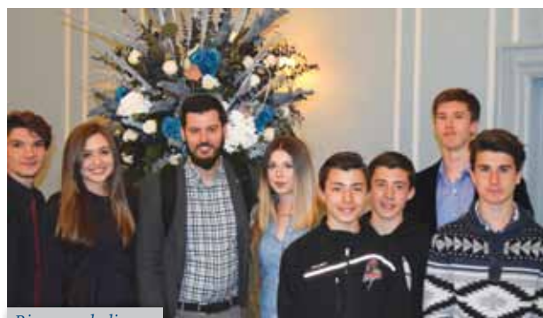
Rimac s mladima

U slijedu zanimljivih događaja iz prve polovice godine osobito se ističe posjet Mate Rimca i njegov govor u seriji predavanja AMCA Toronto Lecture Series , održan 9. svibnja u Faculty Club-u . Izvrsna posjećenost te mnogo mladih u publici obilježili su ovu večer s mladim izumiteljem i poduzetnikom. Rimac je uspio prenijeti svoju viziju razvitka električnih automobila te projekte koji slijede u skoroj budućnosti, uz nagovještaj vlastitih novih projekata. U svojoj tvornici u Sv. Nedjelji, Rimac i njegov tim rade na razvoju autonomnih vozila, te usavršavanju pojedinih dijelova za električne automobile poput baterija i motora. Na kraju, uz gromoglasan pljesak Rimcu uslijedila su i mnoga pitanja u vezi s njegovim tehnologijama te vrijeme uz laganu zakusku i piće gdje su se izmjenjivali dojmovi o ovom mladom genijalnom izumitelju.